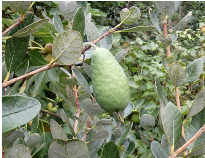
Figura 1. Feijoa en estado de maduración.

Hasta la fecha no se conocen todos los componentes que tiene esta fruta. Sin embargo, Shaw y colaboradores mostraron que en la cáscara de la feijoa, existe una sustancia llamada pectina, que al ser consumida, ayuda al control de la presión sanguínea; esto conlleva beneficios para aquellos pacientes que sufren de hipertensión (incremento de presión arterial). Así mismo se ha reportado que la pectina ayuda a disminuir los niveles de colesterol en sangre (Shaw, Allen y Yates, 1990).