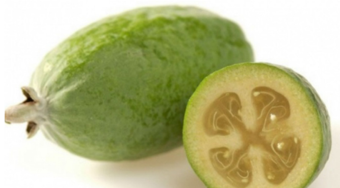
Figura 2. Pulpa de Feijoa con altos beneficios nutricionales.

Por todos los beneficios reportados que presenta la feijoa en el estado nutricional del ser humano junto a la escasa información que se tiene sobre sus efectos en los pacientes que padecen diabetes mellitus (altos niveles de azúcar en sangre), en nuestro laboratorio decidimos investigar como objetivo principal si el jugo de la feijoa ayuda a reducir los niveles de glucosa en sangre.