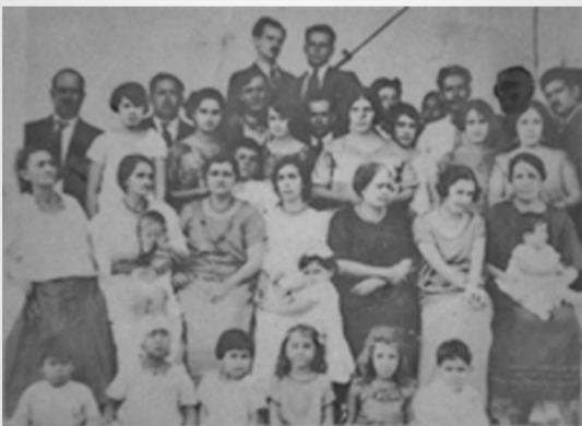
Familia Figueroa Esquinca