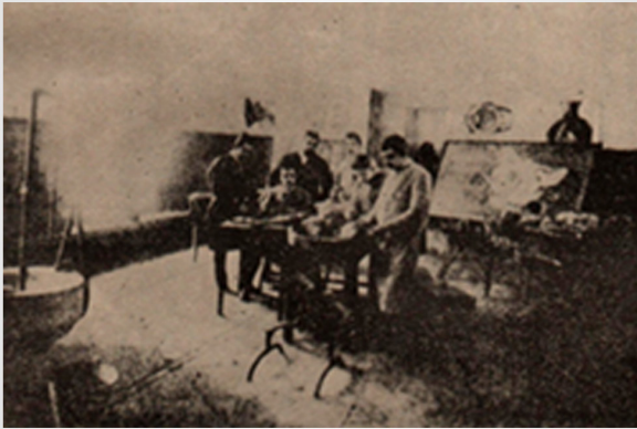
Prácticas de Medicina