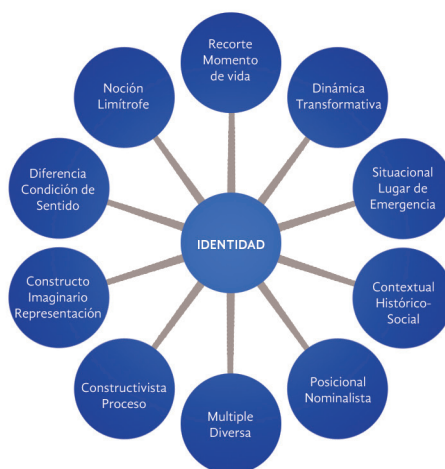
Figura 1. Posicionamiento teórico sobre la noción de Identidad

En esta definición pueden identificarse algunos posicionamientos teórico-epistemológicos que orientan la perspectiva bajo la cual sitúo el estudio de las identidades de los jóvenes de la UNICH. Mi propuesta completa sobre la identidad se resume en la figura 1 y parte de varias posturas teóricas. A continuación explico con detalle cada una de las características o elementos que me ayudan a clarificar y explicar la noción de identidad pertinente para esta investigación.