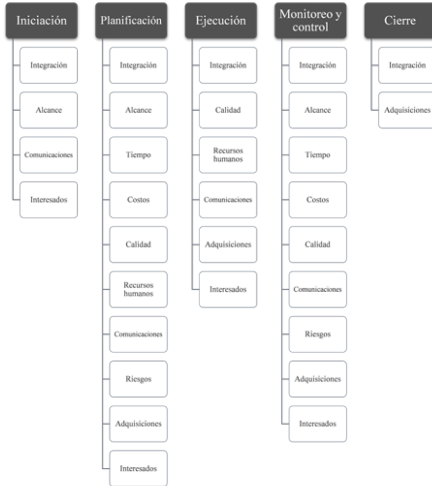
Figura 1. Vinculación entre las áreas de conocimiento y los procesos de gestión de proyectos.