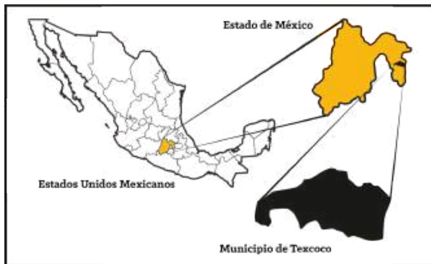
Imagen I. Ubicación del municipio de Texcoco a nivel nacional.