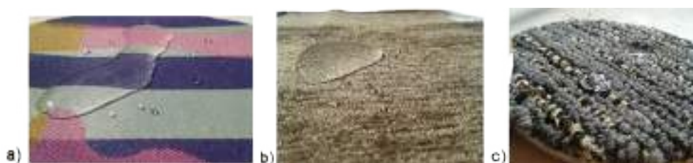
Figura.1 Resultados de las pruebas de hidrofobicidad a textiles.

La compañía Aitex proporcionó a este grupo de investigación un muestrario de telas con propiedades hidrofóbicas. Dichas telas fueron analizadas con el propósito de verificar las propiedades funcionales que poseen. La Figura 1 muestra a) la prueba de hidrofobicidad desarrollada en un textil para uso en mantelería, b) la prueba a una fibra de alfombra y c) la prueba a un textil para tapicería. Como se puede ver, el agua es incapaz de penetrar la fibra.