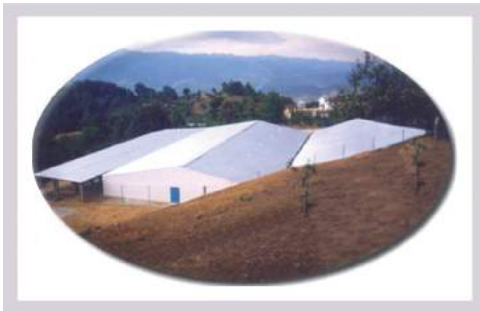
Foto 1. Colector de agua de lluvia, Yalentay, Zinacantán, Chiapas.

Así, en términos prácticos se puede decir que un producto científico o tecnológico es transferido con éxito cuando es comprendido por los usuarios, cubre una necesidad personal o social (bien utilitario), es usado, operado, mantenido o reparado por los mismos (o saben dónde acudir para tal efecto). Esto fue lo que ocurrió con el CALLC, donde ahora cada 15 de abril se realiza la fiesta del agua, celebración religiosa popular de carácter sincrético de este pueblo zinacanteco. Con base en estas experiencias se diseñó el proyecto: Diseño, construcción y transferencia de una casa ecológica con tecnologías apropiadas (CETA) para el desarrollo sustentable de las comunidades indígenas de los Altos de Chiapas cuyos objetivos fundamentales se centran en: a). Construir y evaluar una vivienda sustentable en Yalentay, constituida por una casa de 50 m 2 como mínimo (la superficie se ajusta a las normas de operación del “Programa de vivienda rural para el año fiscal 2014” de SEDATU), b). Evaluar más de diez tecnologías apropiadas integradas a la misma, cuya meta es conservar los recursos naturales como el agua, suelo, aire, bosque y también elevar el nivel de vida de los pobladores para abatir la pobreza.