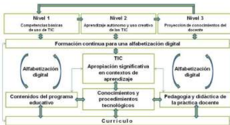
Esquema 1. Programas de formación para una alfabetización digital

A partir de los resultados obtenidos, se observa la necesidad de diseñar un esquema de formación–alfabetización digital multinivel, que involucre a los profesores en el mismo proceso, de manera que esta “apropiación de las TIC” no sea sólo un asunto externo, sino que produzca su interiorización para que sean ellos quienes en un momento dado programen los requerimientos de acuerdo a sus necesidades educativas.